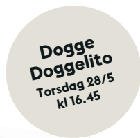
Dogge Doggelito Torsdag 28/5 kl 16.45