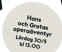
Hans och Gretas operaäventyr Lördag 30/5 kl 13.00