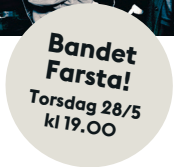
Bandet Farsta! Torsdag 28/5 kl 19.00