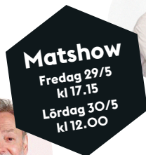
Matshow Fredag 29/5 kl 17.15 Lördag 30/5 kl 12.00