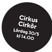
Cirkus Cirkör Lördag 30/5 kl 14.00