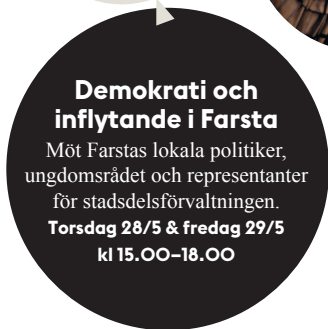
Demokrati och inflytande i Farsta Möt Farstas lokala politiker, ungdomsrådet och representanter för stadsdelsförvaltningen. Torsdag 28/5 & fredag 29/5 kl 15.00-18.00