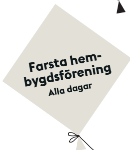
Farsta hem- bygdsförening Alla dagar