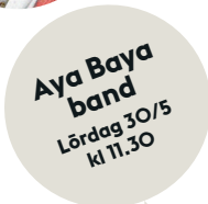
Aya Baya band Lördag 30/5 kl 11.30