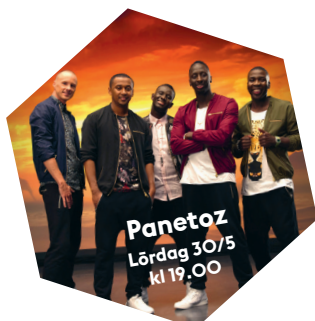
Panetoz Lördag 30/5 kl 19.00